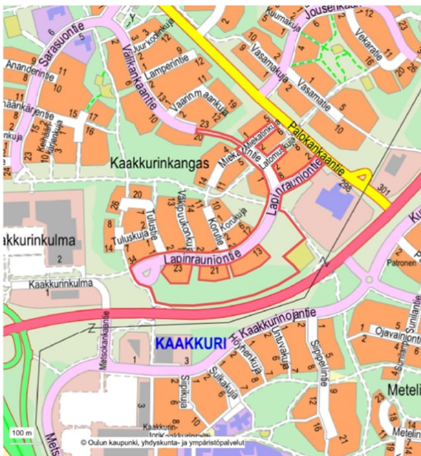
Kuva 1. Suunnittelualue opaskartalla

Suunnittelualueen kaduilla on päällyste- ja routavaurioita ja alueen vesihuoltoverkosto on saneerauksen tarpeessa.